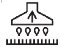
механизированная очистительная головка для водоструйной очистки.