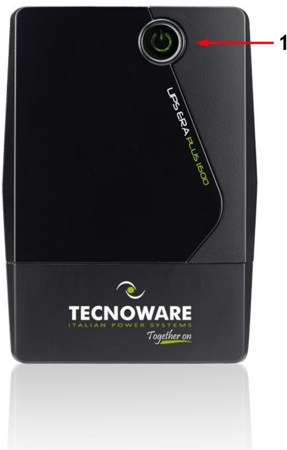
Figura 1 - Pannello Frontale