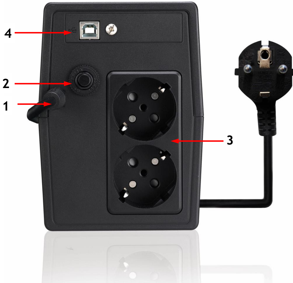
Figura 3 - Pannello Posteriore

Sul retro di ERA PLUS sono presenti (vedi figura 3):