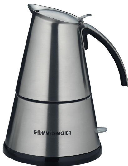
EKO 364/E EKO 366/E