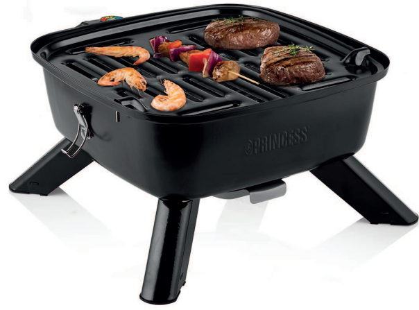
Hybrid barbecue 01.112256.01.001

PARTS DESCRIPTION / ONDERDELENBESCHRIJVING / DESCRIPTION DES PIÈCES / TEILEBESCHREIBUNG / DESCRIZIONE DE LAS PIEZAS / DESCRIZIONE DOS COMPONENTES / DESCRIZIONE DELLE PARTI / BESKRIVNING AV DELAR / OPIS CZĘŚCI / POPIS SOUČÁSTÍ / POPIS SUČASTI / ОПИСАНИЕ ЗАПЧАСТИ