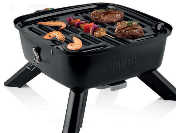
Hybrid barbecue 01.112256.01.001

PARTS DESCRIPTION / ONDERDELENBESCHRIJVING / DESCRIPTION DES PIÉCES / TEILEBESCHREIBUNG / DESCRIPCIÓN DE LAS PIEZAS / DESCRIÇÃO DOS COMPONENTES / DESCRIZIONE DELLE PARTI / BESKRIVNING AV DELAR / OPIS CZĘŚCI / POPIS SOUČÁSTI / POPIS SUČASTI / ОПИСАНИЕ ЗАПЧАСТИ