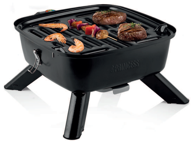
Hybrid barbecue 01.112256.01.001

PARTS DESCRIPTION / ONDERDELENBESCHRIJVING / DESCRIPTION DES PIÉCES / TEILBESCHREIBUNG / DESCRIPCIÓN DE LAS PIEZAS / DESCRIÇÃO DOS COMPONENTES / DESCRIZIONE DELLE PARTI / BESKRIVNING AV DELAR / OPIS CZĘŚCI / POPIS SOUČÁSTÍ / POPIS SOUČÁSTÍ / ОПИСАНИЕ ЗАПЧАСТІ