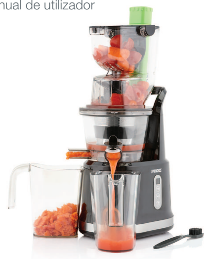
Slow Juicer Easy Fill 01.202045.01.001

PARTS DESCRIPTION / ONDERDELENBESCHRIJVING / DESCRIPTION DES PIÈCES / TELEBESCHREIBUNG / DESCRIPCIÓN DE LAS PIEZAS / DESCRIÇÃO DOS COMPONENTES / DESCRIZIONE DELLE PARTI / BESKRIVNING AV DELAR / OPIS CZĘŚCI / POPIS SOUČÁSTÍ / POPIS SUČASTI