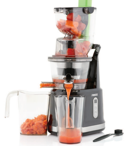
Slow Juicer Easy Fill 01.202045.01.001

PARTS DESCRIPTION / ONDERDELENBESCHRIJVING / DESCRIPTION DES PIÈCES / TEILEBESCHREIBUNG / DESCRIPCIÓN DE LAS PIEZAS / DESCRIÇÃO DOS COMPONENTES / DESCRIZIONE DELLE PARTI / BESKRIVNING AV DELAR / OPIS CZĘŚCI / POPIS SOUČÁSTÍ / POPIS SÚČASTÍ