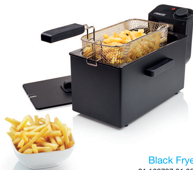
Black Fryer 01.182727.01.050

PARTS DESCRIPTION / ONDERDELENBESCHRIJVING / DESCRIPTION DES PIÈCES / TEILEBESCHREIBUNG / DESCRIPCIÓN DE LAS PIEZAS / DESCRICÃO DOS COMPONENTES / DESCRIZIONE DELLE PARTI / BESKRIVNING AV DELAR / OPIS CZĘŚCI / POPIS SOUČÁSTÍ / POPIS SUČASTI