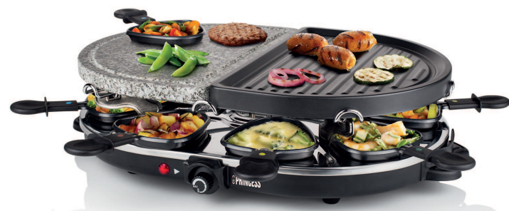
Raclette 8 Oval Stone & Grill Party 01.162710.01.001

PARTS DESCRIPTION / ONDERDELENBESCHRIJVING / DESCRIPTION DES PIÈCES / TEILEBESCHREIBUNG / DESCRIPCIÓN DE LAS PIEZAS / DESCRIÇÃO DOS COMPONENTES / DESCRIZIONE DELLE PARTI / BESKRIVNING AV DELAR / OPIS CZĘŚCI / POPIS SOUČÁSTÍ / POPIS SÚČASTÍ