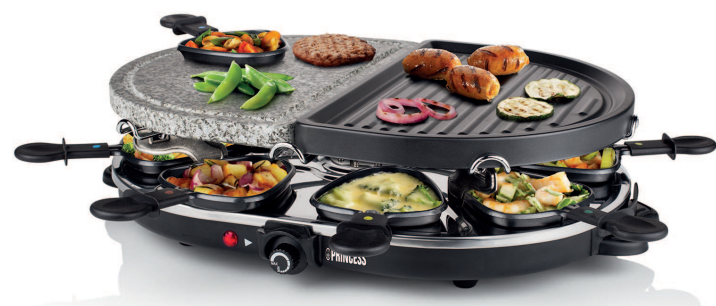
Raclette 8 Oval Stone & Grill Party 01.162710.01.001

PARTS DESCRIPTION / ONDERDELENBESCHRIJVING / DESCRIPTION DES PIÈCES / TEILEBESCHREIBUNG / DESCRIPCIÓN DE LAS PIEZAS / DESCRIÇÃO DOS COMPONENTES / DESCRIZIONE DELLE PARTI / BESKRIVNING AV DELAR / OPIS CZĘŚCI / POPIS SOUČÁSTÍ / POPIS SUČASTI