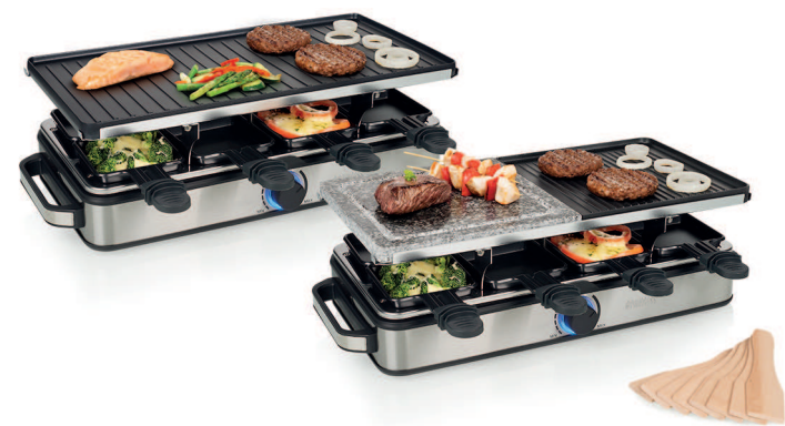
Raclette 8 Stone and Grill Deluxe Raclette 8 Grill Deluxe