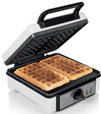
Waffle iron 01.132397.01.001

PARTS DESCRIPTION / ONDERDELENBESCHRIJVING / DESCRIPTION DES PIÈCES / TEILEBESCHREIBUNG / DESCRIPCIÓN DE LAS PIEZAS / DESCRIÇÃO DOS COMPONENTES / DESCRIZIONE DELLE PARTI / BESKRIVNING AV DELAR / OPIS CZĘŚCI / POPIS SOUČÁSTÍ / POPIS SUČASTI / ОПИСАНИЕ ЗАПЧАСТІ