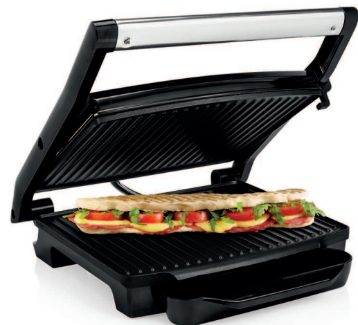
Panini Grill 01.112415.01.001

PARTS DESCRIPTION / ONDERDELENBESCHRIJVING / DESCRIPTION DES PIÈCES / TEILEBESCHREIBUNG / DESCRIPCIÓN DE LAS PIEZAS / DESCRIÇÃO DOS COMPONENTES / DESCRIZIONE DELLE PARTI / BESKRIVNING AV DELAR / OPIS CZĘŚCI / POPIS SOUČÁSTÍ / POPIS SÚČASTÍ / ОПИСАНИЕ ЗАПЧАСТІ