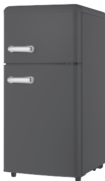
MF100RCDP MF100CCDP MF100YCDP MF100BCDP