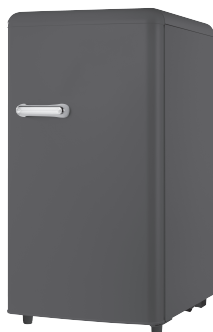
MF100R MF100C MF100Y MF100B