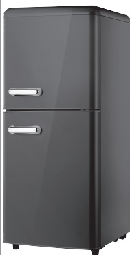
MF110RCDP MF110CCDP MF110YCDP MF110BCDP