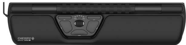
CHERRY ROLLERMOUSE™ Ergonomic Mouse Solution